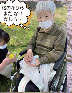
桜の花びらまだないかしら~