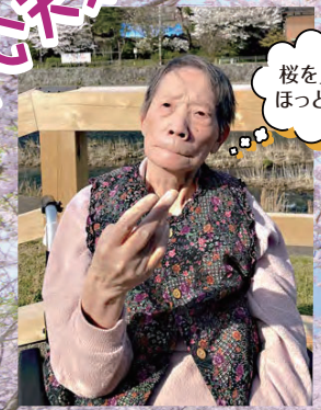
桜を見るとほっとするワ