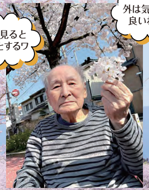
外は気持ち良いねえ