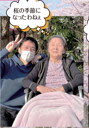
桜の季節になったわねえ